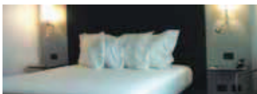
Cod. 25156 Prod. E0-11540

AC Bologna Valutazione Alpitour ●●●●○ Cat. Uff. ★★ Situato nella zona moderna della città, accanto a via Stalingrado, nelle immediate vicinanze della Fiera, della stazione ferroviaria e del centro storico. Questa struttura moderna offre dei servizi completi ed efficienti. Avrete a vostra disposizione un bar, un ristorante, palestra, servizi business e bagno turco. Inoltre, alla reception troverete tutte le informazioni turistiche di cui avrete bisogno.