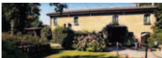
Cod. 25051 Prod. E0-11540

Prezzi periodi fiere su richiesta - Sposi : bottiglia di spumante in camera.