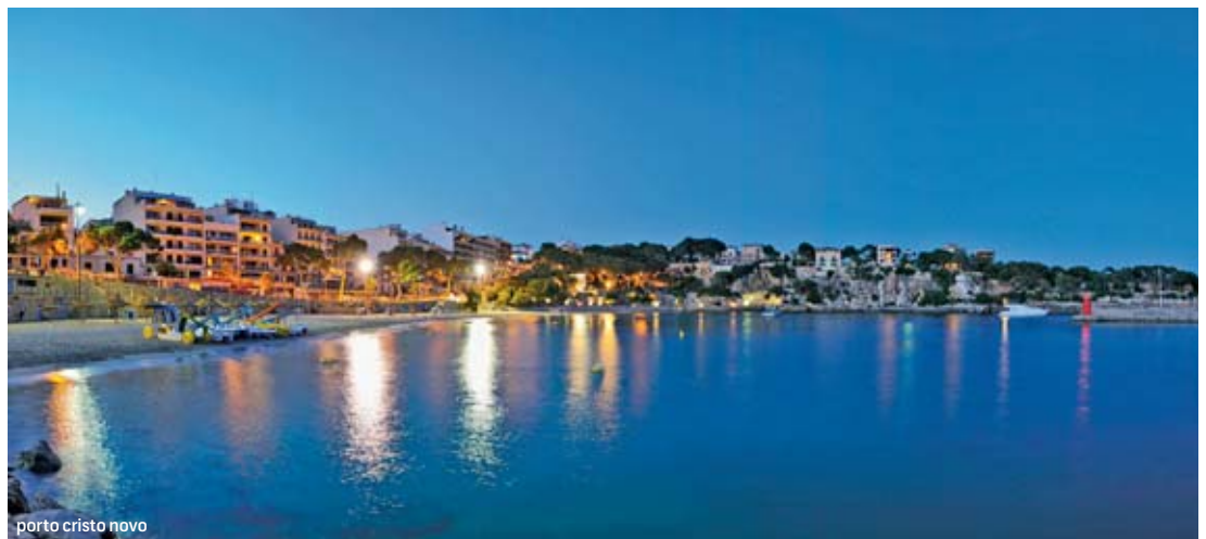
porto cristo novo