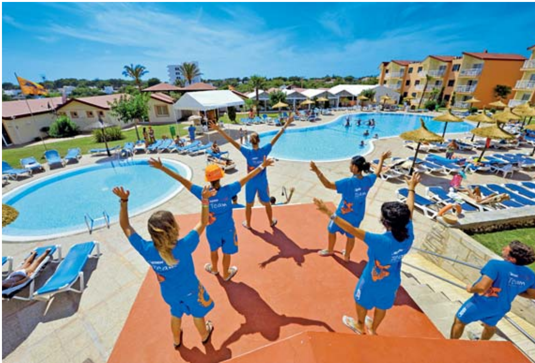
EDEN VILLAGE CALA 'N BLANES MINORCA, ISOLE BALEARI, SPAGNA