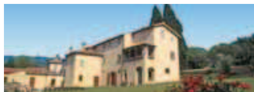
Cod. 22685 Prod. E0-11540