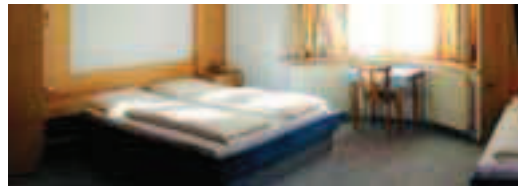
Cod.8169 Prod. E0-E1590

Soggiorno minimo 3 notti dal 29/12 al 2/1, minimo 2 notti dal 5/12 all'8/12 - Supplemento € 13 per soggiorni ven/dom nei periodi 20/11-4/12 e 9-24/12 (minimo 2 notti); € 30 nei periodi 5-8/12 e 19-31/1. Riduzione € 7 nei periodi 1-19/11 e 10-18/1 - 4=3 : 4 notti al prezzo di 3 nei periodi 8-21/5, 1-19/11, 10-16/1