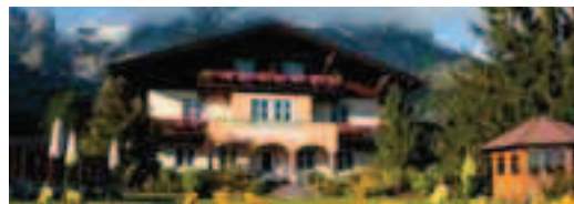
Cod.22579 Prod. E0-E1590