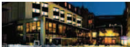
Cod. 44176 Prod. E0-E1590

Soggiorno minimo 3 notti dal 29/12 al 2/1.0