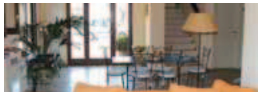
Cod. 22529 Prod. E0-11540