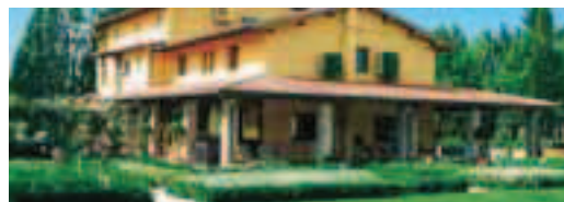
Cod. 22681 Prod. E0-11540