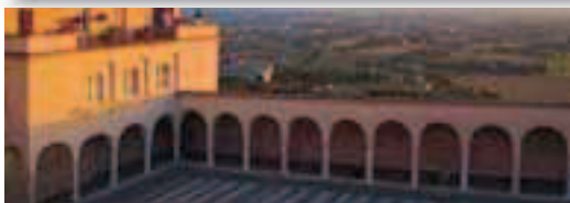
Cod. 25154 Prod. E0-11540